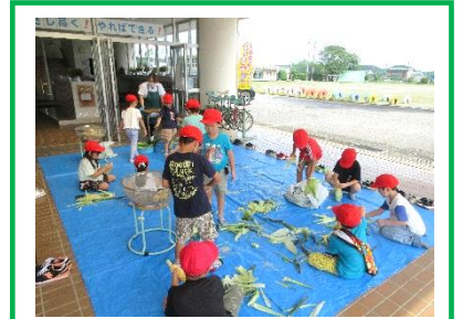
【どうもろこしの皮むき】7/17